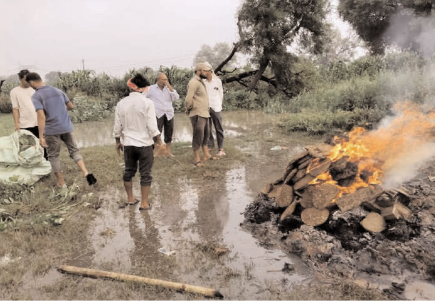
रात में जले शव को सुबह फिर जलाना पड़ा